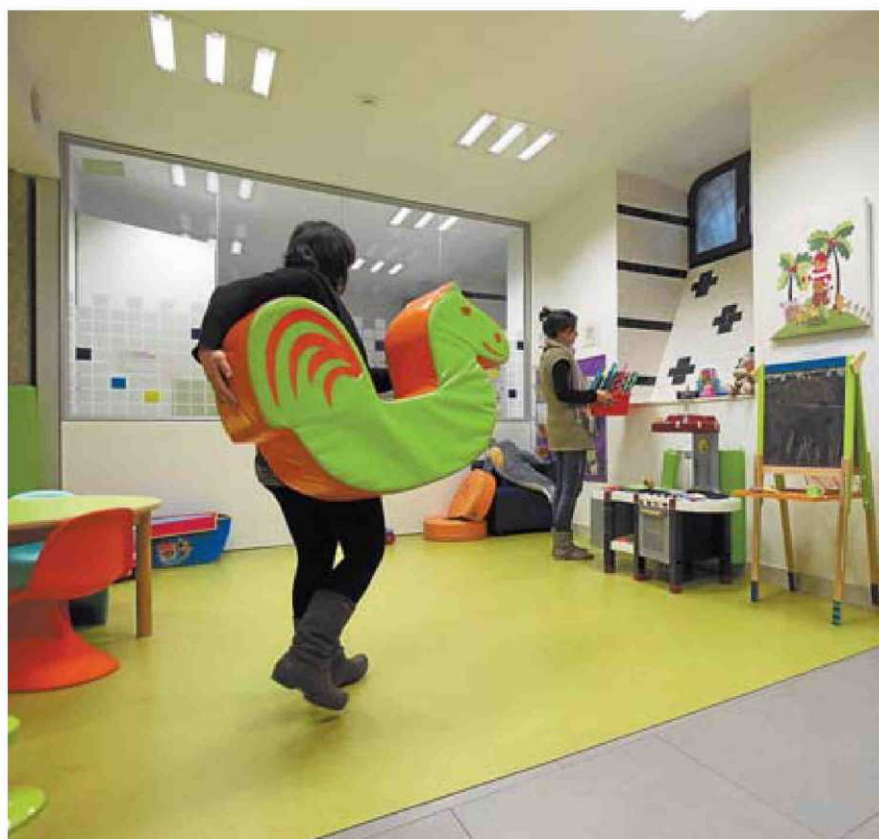
Dos supervisoras recolocan los juguetes en el punto de encuentro de Donostia.

El año pasado, un total de 821 familias en Euskadi fueron derivadas a este tipo de centros. Gipuzkoa cuenta con uno en Donostia que durante el pasado año fue utilizado por un total de 192 familias que contaban con 279 menores a su cargo, 138 niñas y 141 niños. Así lo refleja el 'Informe evaluativo sobre los Puntos de Encuentro Familiar por derivación judicial' elaborado por el Ins-